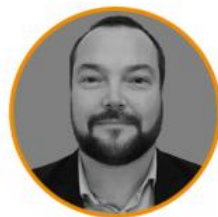
Ludovic BEY Responsable de la Sécurité Numérique, Ministère de la justice